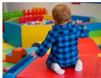
7 Overige, eerder aangekondigde en te verwachten voorstellen

Deze special bevat voorstellen van het kabinet die de komende periode in het parlement worden behandeld. De voorgestelde maatregelen treden per 1 januari 2022 in werking, tenzij anders is vermeld.